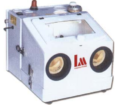
Tyyppi LM S1N

Paino 14 kg, suutin 0,8 - 1,0 - 1,2 mm, 3 käsikappaletta, 3 kennoa, 3 paineensäädintä, hinta 2.450,00 €