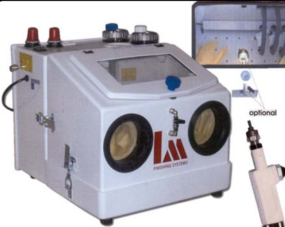
Tyyppi LM S2N

Paino 17 kg, suutin Ø 1,0 mm, hinta 1.435,00 €