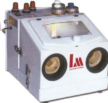
Tyyppi LM S3N

Paino 14 kg, suutin 0,8 - 1,0 - 1,2 mm, 3 käsikappaletta, 3 kennoa, 3 paineensäädintä, hinta 2.450,00 €