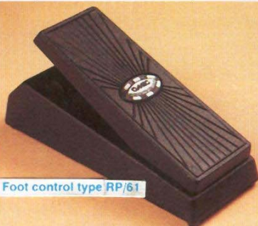
Foot control type RP/61